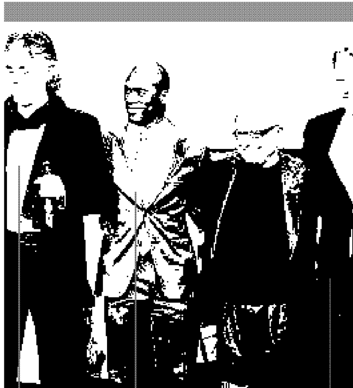
TENORE Andrea Bocelli, il tenore