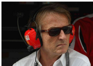
Nella Foto: Luca Cordero di Montezemolo (ITA), Presidente Scuderia Ferrari

terzo polo/2. Obiettivo amministrative. Forse l'annuncio al convegno di Milano del 27.